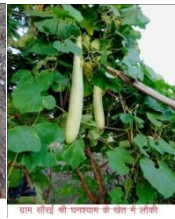
डाम सौर्य श्री पनपनका के बाबा की लोही