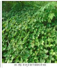
श्रीमती- शर्मिष्ठा- श्री मंगू मू की वं जलपट्ट की बरक