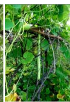
दरवाज के महान में लोही