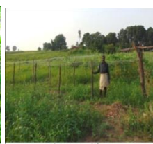
श्री दरवाज, डाम- सौर्य